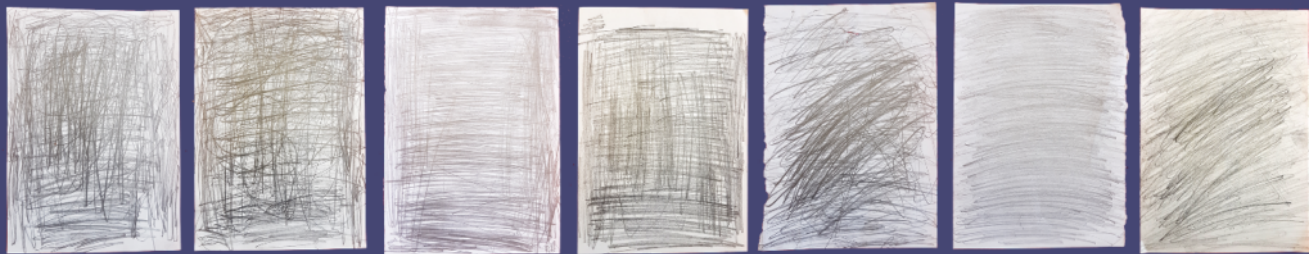
Alter des Kunstwerks: 490 Jahre / Zeit: 49 Sek.